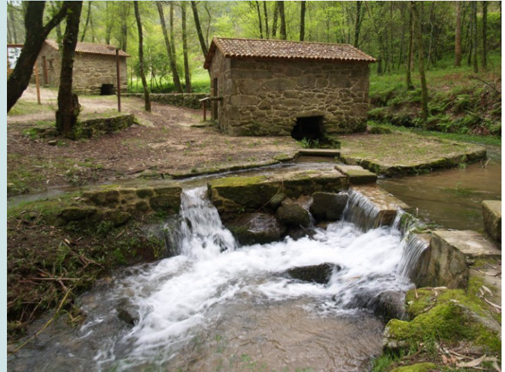
Muíños en Simes.