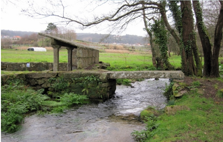
Lavadoiro e ponte en Lores.