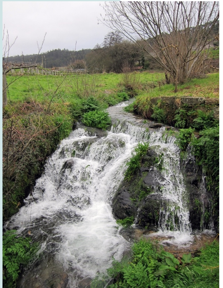
Pequena ferveza entre Lores e Simes.