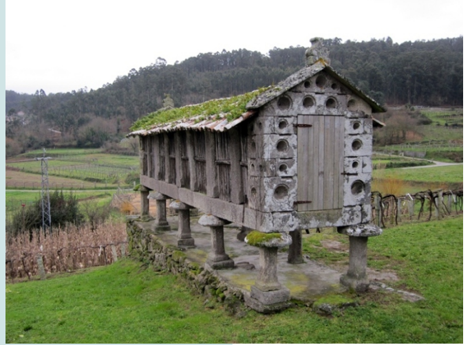
Hórreo a carón da igrexa parroquial de Simes.