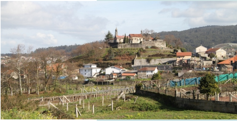
Santuario de San Bieito de Lores. No adro da capela consérvanse varias árbores centenarias: un castiñeiro, unha robinia e un carballo.