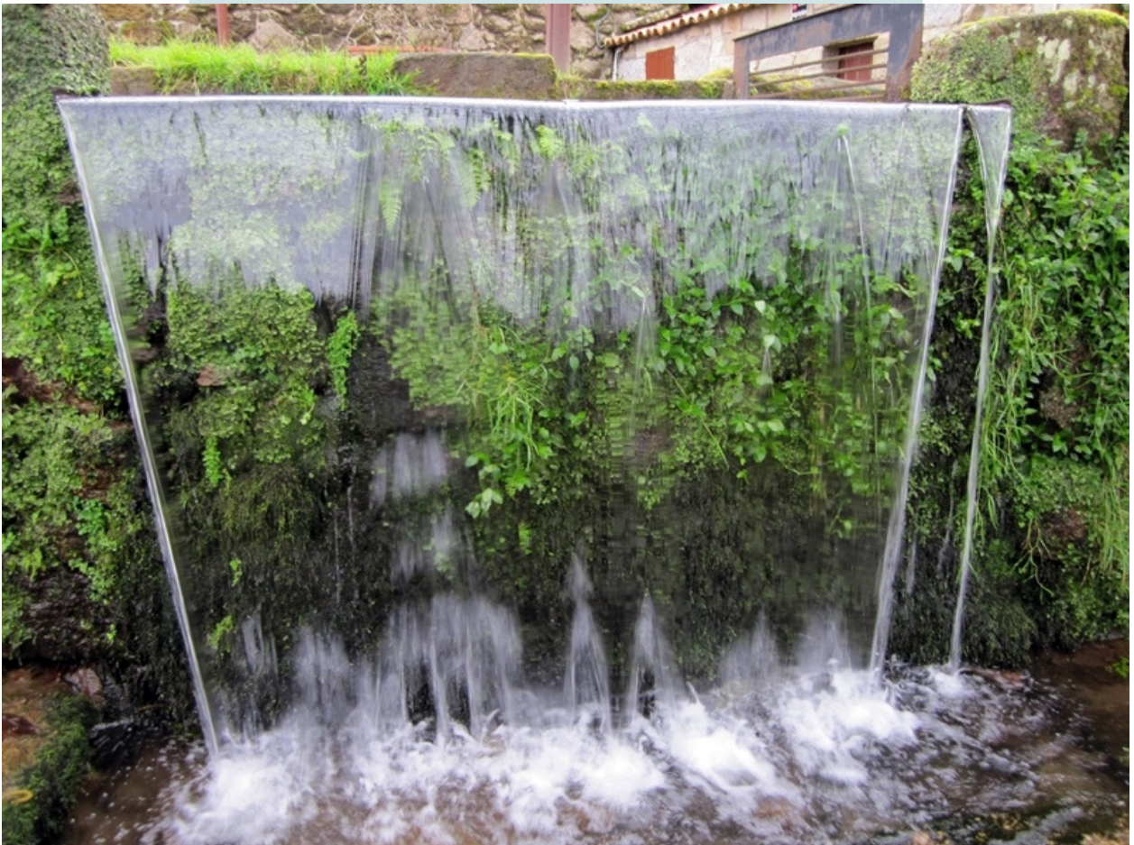
Aliviadoiro da canle do muíño do Ferreiro en Lores.